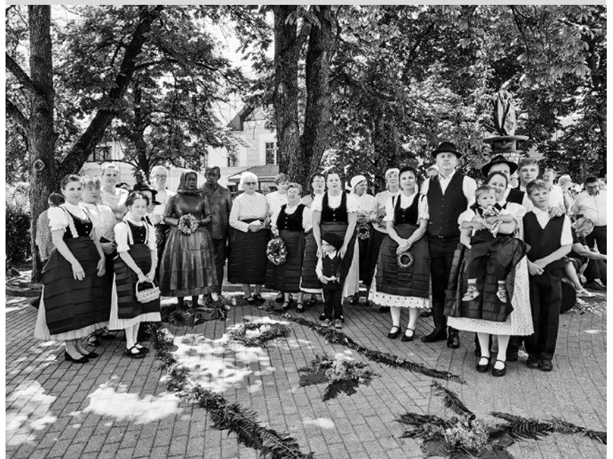
A Heimatverein felhívására sokan sváb népviseletben és sváb dalokat énekelve vettek részt a körmeneten.