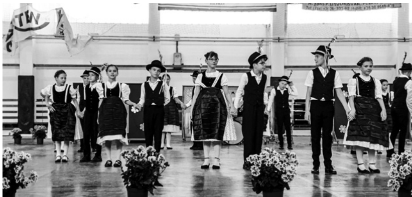
Táncünnep, fotók: Marlok Nikolett