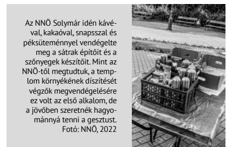
Az NNÖ Solymár idén kávéval, kakaóval, snapszal és péksüteménnyel vendégelte meg a sátrak építőit és a szőnyegek készítőit. Mint az NNÖ-től megtudtuk, a templom környékének díszítését végzők megvendégelésére ez volt az első alkalom, de a jövőben szeretnék hagyománnyá tenni a gesztust.