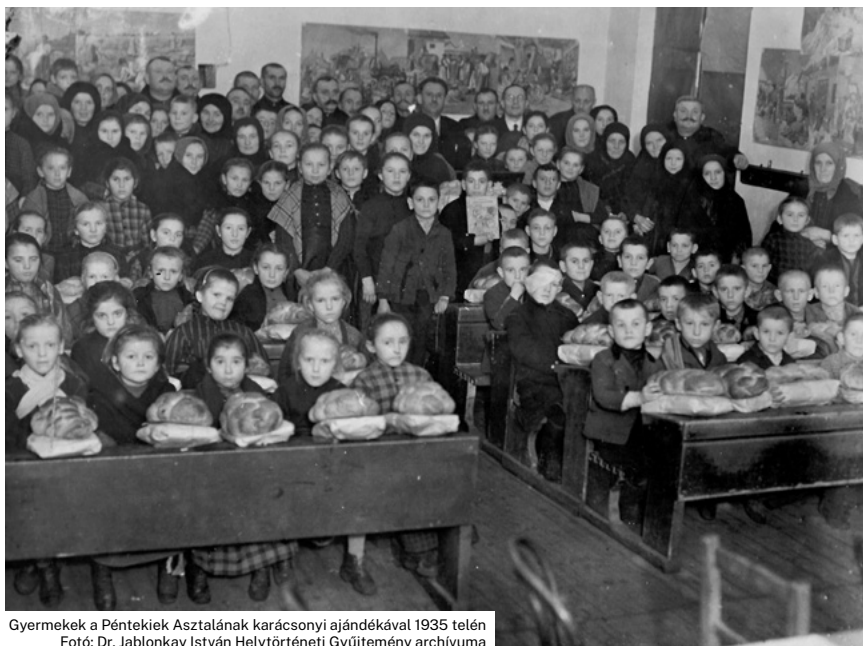
Gyermekek a Péntekiek Asztalának karácsonyi ajándékával 1935 telén