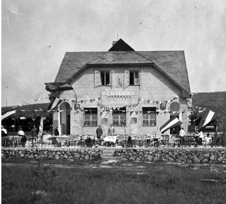
A Péntekiek Asztalának Fritisch menedékháza Solymáron