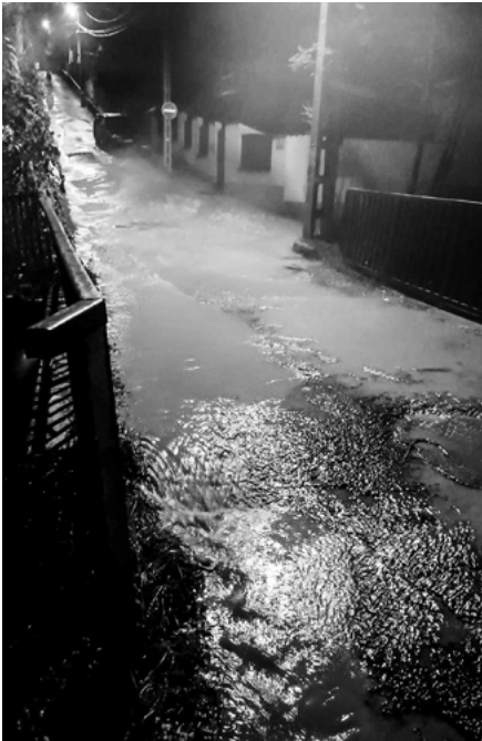
Hömpölyög a víz a Dózsa György utcában